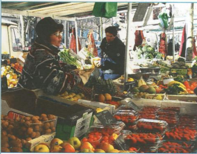
Marché de Port-Royal, à Paris.

Les grands magasins traditionnels, par exemple le Printemps, les Galeries Lafayette, les Nouvelles Galeries, se sont très bien adaptés à l'évolution des habitudes d'achat. Ils restent très fréquentés par les Français comme par les touristes qui viennent et chercher des produits de luxe (vêtements, parfums, etc.). Il existe aussi des magasins bon marché et, depuis quelques années, les magasins de dépôt-vente* ont beaucoup de succès. Dans ces magasins, on peut déposer ou acheter des vêtements déjà utilisés ou dégriffés*.