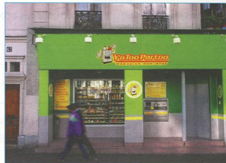
Un distributeur automatique de nourriture.