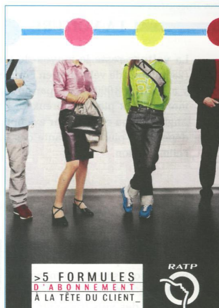
Une publicité de la RATP pour le métro.

5 À travers ces personnages, quelle image la RATP veut-elle donner du métro parisien ?