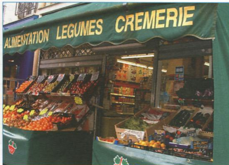
Un magasin de proximité.

Le marché* commence tôt le matin (vers 7h30-8 heures) et se termine aux alentours de 13h30 : c'est alors l'heure des bonnes affaires ! Les commerçants soldent les produits frais invendus.