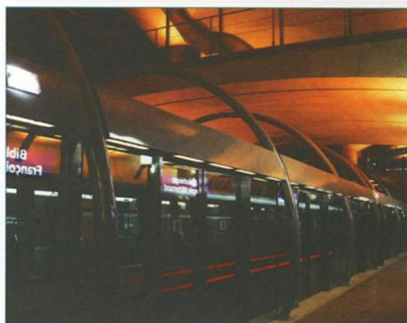
Le métro parisien a un siècle et compte 14 lignes. Météor, le métro le plus récent, est automatisé.

Pour se déplacer facilement et rapidement en ville, certains choisissent la moto , la mobylette ou le scooter , qui est à nouveau à la mode. La création de pistes cyclables dans les grandes villes rend la circulation plus sûre. Ainsi, les plus sportifs peuvent utiliser sans trop de danger le vélo et, phénomène récent, les rollers (patins à roulettes).