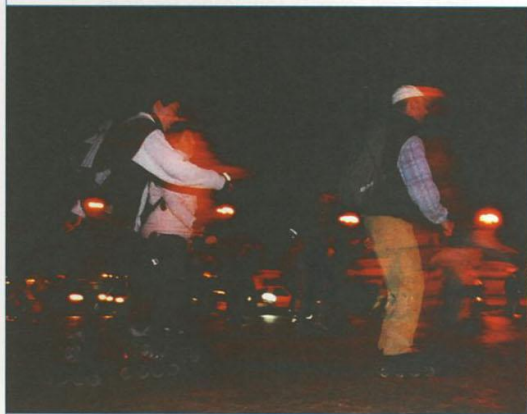
Le vendredi soir, ceux qui aiment les rollers se donnent rendez-vous pour une balade dans les rues de Paris qui dure plusieurs heures.